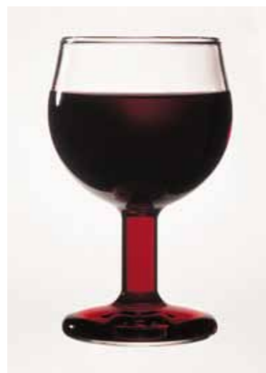
— Verre rouge Laurence BRABANT