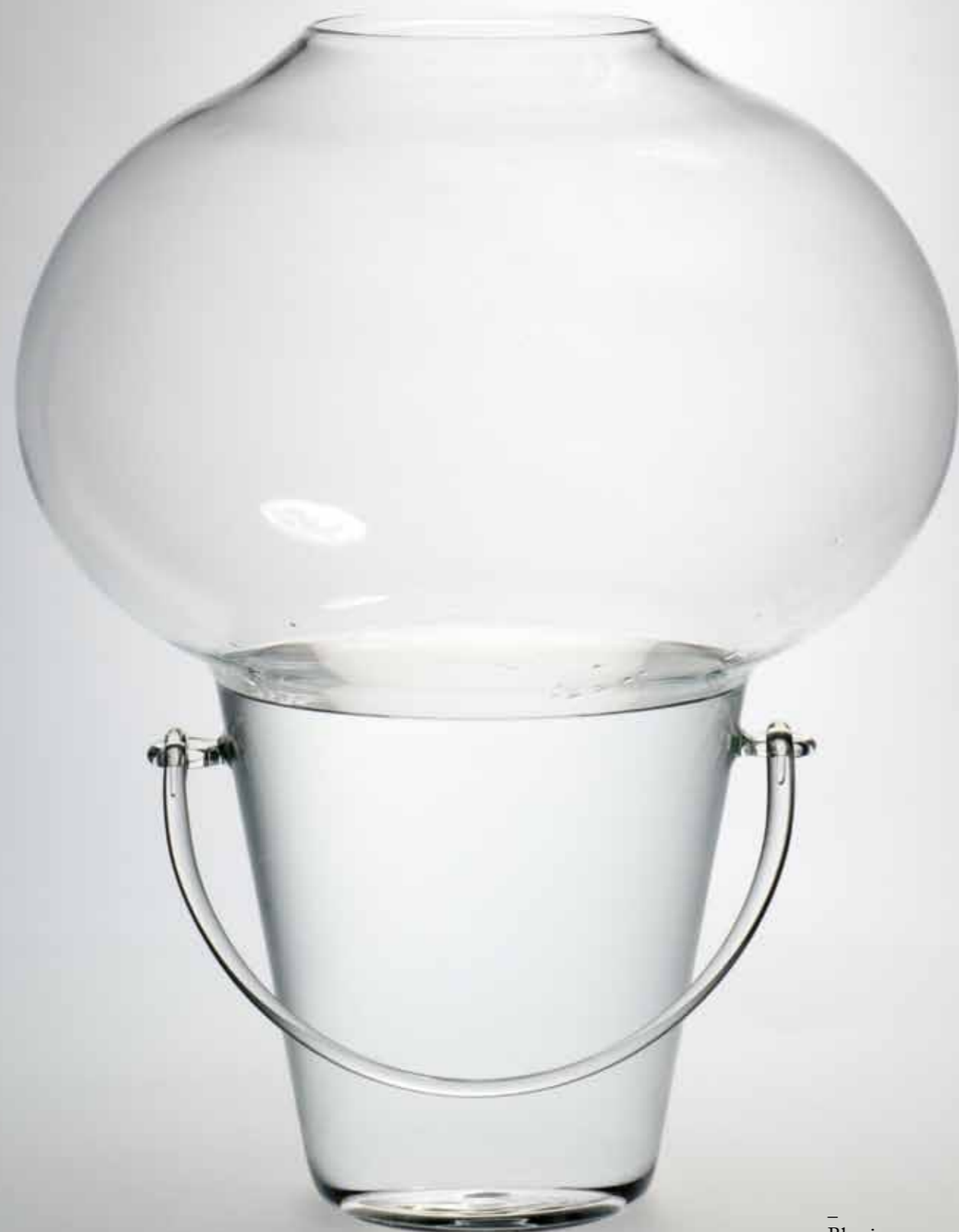
— Blowing Laurence BRABANT