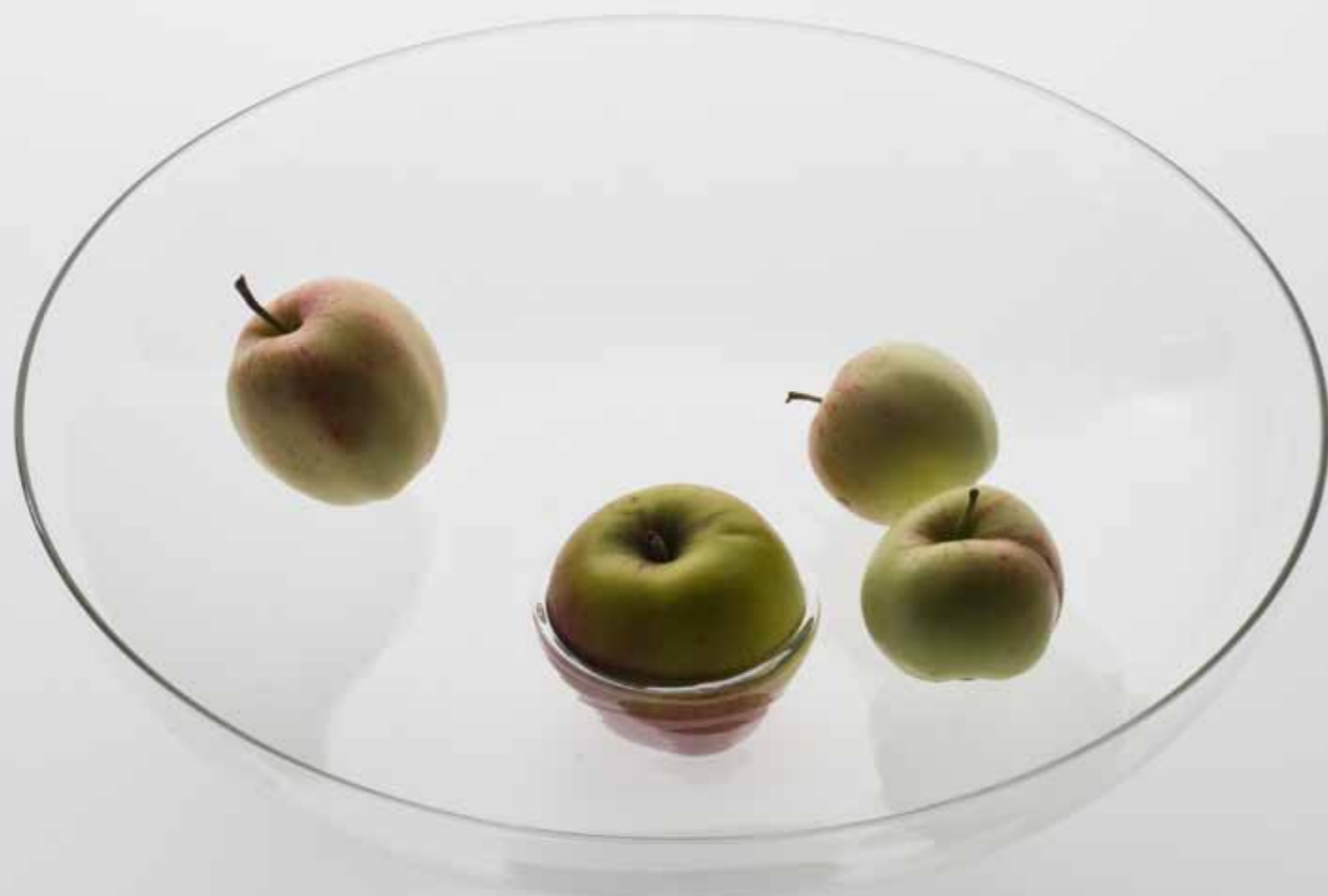
— Omibic Laurence BRABANT